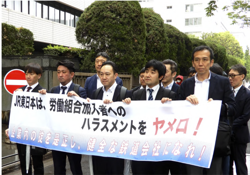
▲ 東京高等裁判所前にて原告4名と仲間たち