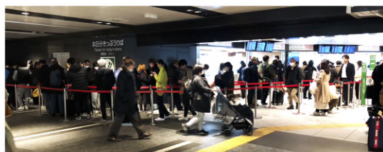
▲ 2023 年末の東京駅のみどりの窓口は大混雑していた

現在、政府や国会をはじめとした政治により、地方ローカル線をはじめとした鉄道ネットワークの在り方が検討されています。しかし、その鉄道の現場で働く私たちが「輸送サービス労組未来ビジョン」の実現を通じて、政治へ働きかけることも必要です。そのために、国会や地方行政に携わる議員の所属するJTUSU議員懇談会や、地域の中に在る労働組合（ジェイアールバス関東労働組合や西武バスユニオンなど）や市民団体（ホーム転落をなくす会やワーカーズコープなど）との連帯の輪を拡げていきます。そして、さらに多くの方々と連帯した運動をつくり出していきます。