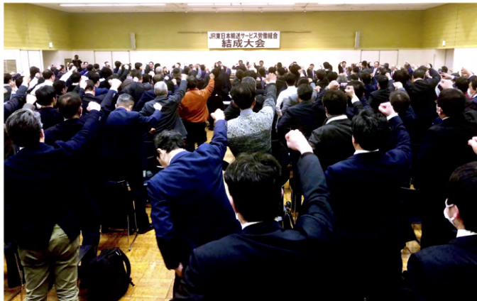
▲ 2020年2月10日の結成大会の様子

私たちJR東日本輸送サービス労働組合（略称：輸送サービス労組）は、2020年2月10日に「すべての仲間のために」を合言葉に結成しました。