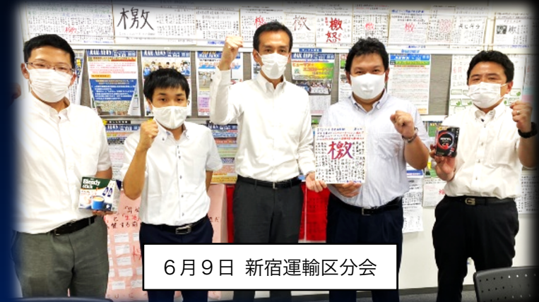
6月9日 新宿運輸区分会

新型コロナウイルスは働く私たちの力で拡大を防いでいる！日々の積み重ねで安全を守り続ける私たちに正当な評価を！ 苦勞を報いるはどんな意味で語ったのか？口先ではないですよ！ コロナ禍でも今までと変わらず社会インフラとして支えてきた。これに対する報いは十分あって然るべき。 コロナ禍で組合員は最先頭で安全とサービスを担ってきた。その対価として夏季手当満額回答を会社はすべきだ！ 苦しいのはみな同じ。先行投資を、社員のモチベーション維持のためにも夏季手当満額を！ 今こそ皆で同じ方向を向き頑張るべき！... ですけど従業員心が離れていってますよ！ いつも通り働いているのだから、いつも通りの支給をするべき！ コロナ禍で肉体的精神的な負担は増している中で奮闘する全組合員社員の想いに会社は応える責任がある。労働者だけが犠牲になるのは許せない！ 我々の労働力の対価は何も変わっていない！ 会社が大変なのは理解するが業務量は増えている。モチベーションを保つため、社員の生活を守るため努力すべき！ 満額絶対要求だ！もつとゆとりを！ ローンが、 いまだコロナ禍においても私たちは安全を第一に日々の業務を遂行している。社員の幸福と生活を守ると会社が言い続けるのであれば、還元することは当たり前前の事だ！ 満額要求！生活のゆとり！ コロナ禍の中奮闘している社員に納得できる額を！ 組合員の頑張りは満額回答によりモチベーションをあげる羽振りよさそうに見えます エssenシャルワーカーとして危険と隣り合わせで働いている報いとして満額回答を！ 会社と社会を支えているのだから。 この状況だからこそ満額勝ち取ってほしい 感染拡大リスクの中でしっかりと働いた分だけの手当を出して欲しい！ 原資はあるのに出さないのは犯罪だ！コロナで苦しむ社員の立場に立て！ コロナによって衛生用品を購入しなければいけなくなった。ギエッセンシャルワーカーとして、苦勞して働いている社員の幸せを実現するのが会社の責任！定期昇給分も含め、満額出すことが社員のモチベーションをあげることに コロナ禍での奮闘に感謝というならば、満額回答で報いるべきだ！モチベーションの低下は安全問題に直結する！ 定昇カットしたのだから夏季手当は満額回答！ ダマされない！ゴマかされない！この間の施策をコロナ感染リスクに気を付けながらも担い、労働の強化に対する対価を会社は評価して支払うべき！これ以上モチベーションを下げさせるな！ コロナ禍でも労働に対する支給をするべき