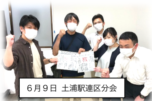
6月9日 土浦駅連区分会

新型コロナウイルスは働く私たちの力で拡大を防いでいる！日々の積み重ねで安全を守り続ける私たちに正当な評価を！ 苦勞を報いるはどんな意味で語ったのか？口先ではないですよ！ コロナ禍でも今までと変わらず社会インフラとして支えてきた。これに対する報いは十分あって然るべき。 コロナ禍で組合員は最先頭で安全とサービスを担ってきた。その対価として夏季手当満額回答を会社はすべきだ！ 苦しいのはみな同じ。先行投資を、社員のモチベーション維持のためにも夏季手当満額を！ 今こそ皆で同じ方向を向き頑張るべき！... ですけど従業員心が離れていってますよ！ いつも通り働いているのだから、いつも通りの支給をするべき！ コロナ禍で肉体的精神的な負担は増している中で奮闘する全組合員社員の想いに会社は応える責任がある。労働者だけが犠牲になるのは許せない！ 我々の労働力の対価は何も変わっていない！ 会社が大変なのは理解するが業務量は増えている。モチベーションを保つため、社員の生活を守るため努力すべき！ 満額絶対要求だ！もつとゆとりを！ ローンが、 いまだコロナ禍においても私たちは安全を第一に日々の業務を遂行している。社員の幸福と生活を守ると会社が言い続けるのであれば、還元することは当たり前前の事だ！ 満額要求！生活のゆとり！ コロナ禍の中奮闘している社員に納得できる額を！ 組合員の頑張りは満額回答によりモチベーションをあげる羽振りよさそうに見えます エssenシャルワーカーとして危険と隣り合わせで働いている報いとして満額回答を！ 会社と社会を支えているのだから。 この状況だからこそ満額勝ち取ってほしい 感染拡大リスクの中でしっかりと働いた分だけの手当を出して欲しい！ 原資はあるのに出さないのは犯罪だ！コロナで苦しむ社員の立場に立て！ コロナによって衛生用品を購入しなければいけなくなった。ギエッセンシャルワーカーとして、苦勞して働いている社員の幸せを実現するのが会社の責任！定期昇給分も含め、満額出すことが社員のモチベーションをあげることに コロナ禍での奮闘に感謝というならば、満額回答で報いるべきだ！モチベーションの低下は安全問題に直結する！ 定昇カットしたのだから夏季手当は満額回答！ ダマされない！ゴマかされない！この間の施策をコロナ感染リスクに気を付けながらも担い、労働の強化に対する対価を会社は評価して支払うべき！これ以上モチベーションを下げさせるな！ コロナ禍でも労働に対する支給をするべき