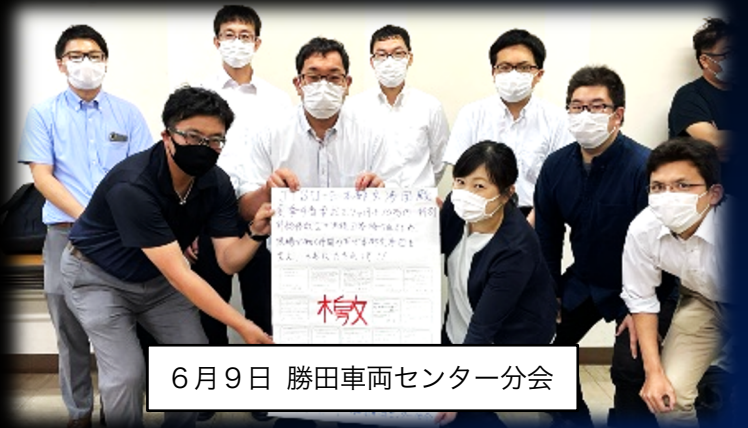
6月9日 勝田車両センター分会