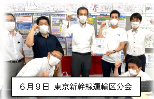
6月9日 東京新幹線運輸区分会