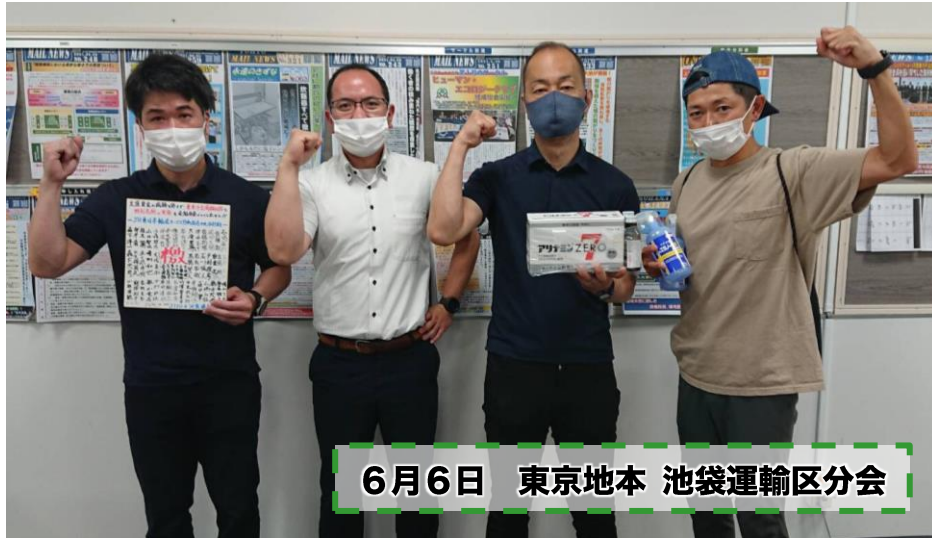
6月6日 東京地本 池袋運輸区分会