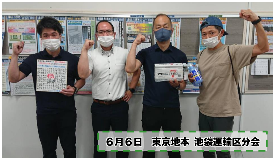
6月6日 東京地本 池袋運輸区分会